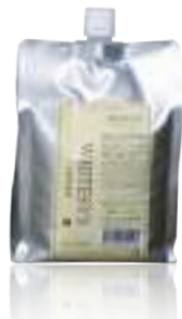
ホワイトイスノーマル (インナー&オファー) 普通毛~ダメージ毛・かかりやすい髪に