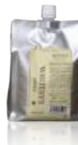
ホワイトイスノーマル (インナー&オファー) 普通毛~ダメージ毛・かかりやすい髪に