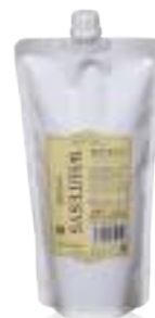
ホワイトイスノーマル (インナー&オファー) 普通毛~ダメージ毛・かかりやすい髪に