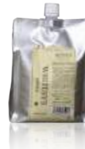
ホワイトイスハード (インナー HD&オファー) 普通毛~健康毛・かかりにくい髪に