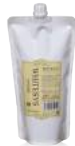
ホワイトイスハード (インナー HD&オファー) 普通毛~健康毛・かかりにくい髪に