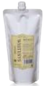
ホワイトイスノーマル (インナー&オファー) 普通毛~ダメージ毛・かかりやすい髪に